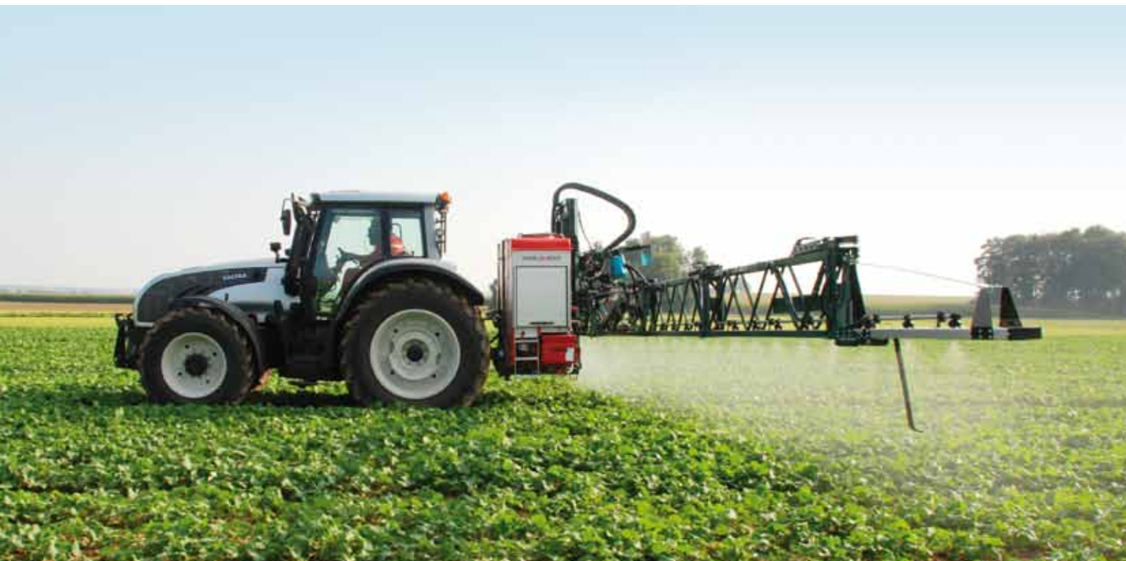
MasterSpray IS pro 1680 I